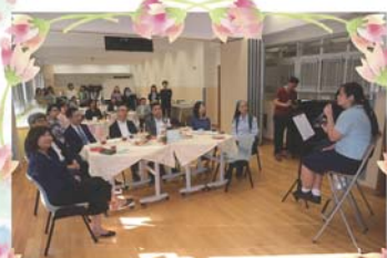
局長和一眾嘉賓首先欣賞學生歌唱表演

2018年12月3日，民政事務局局長劉江華先生在南區區議會主席朱慶虹、副主席陳富明和南區民政事務專員馬周佩芬陪同下，到訪瑪利灣學校和瑪利灣中心。局長首先欣賞學生表演和品嚐學生親自泡製和製作的甜品，對學生的歌聲、甜點和花茶，讚不絕口呢！跟著，由同學陪同下參觀瑪利灣中心和瑪利灣學校的設施。局長特別稱讚中心 Band 房和學校新音樂室的設備，還特意地在音樂室坐下來聆聽同學錄製的歌曲。參觀資訊科技學習室時，局長和南區區議會主席接受了瑪利灣校園電視台的訪問。局長在圖書館看見金庸作品陳列角時，還邀請同學往香港文化博物館內的金庸館參觀。訪校完畢，局長還特意邀請同學和他一起拍照留念呢！