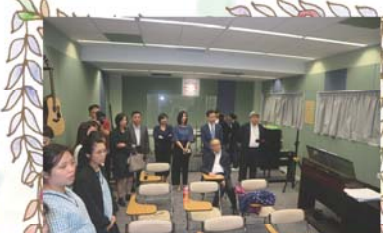
局長和嘉賓們在音樂室聆聽同學錄製的歌曲