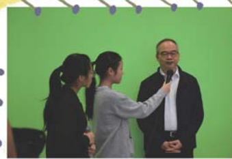
局長接受了瑪利灣校園電視台的訪問